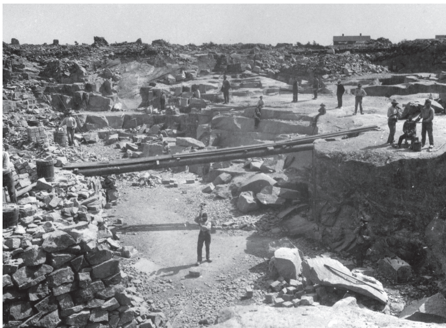
Ett stenbrott vid Herrgården på Tjurkö. 1890-tal.

Tjurkö, Karlskrona skärgård, industriminne och kulturmiljö.